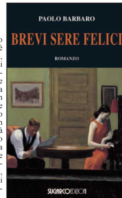
BREVI SERE FELICI romanzo