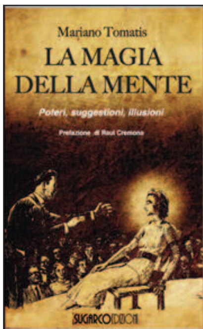
LA MAGIA DELLA MENTE Poteri, suggestioni, illusioni

Introduzione di Raul Cremona pp. 184 - Ill. nel testo - Euro 16,80 ISBN 978-88-7198-574-9