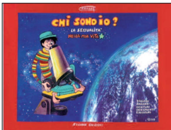
Centro Studi Achille Dedé (Ce.S.A.D.)